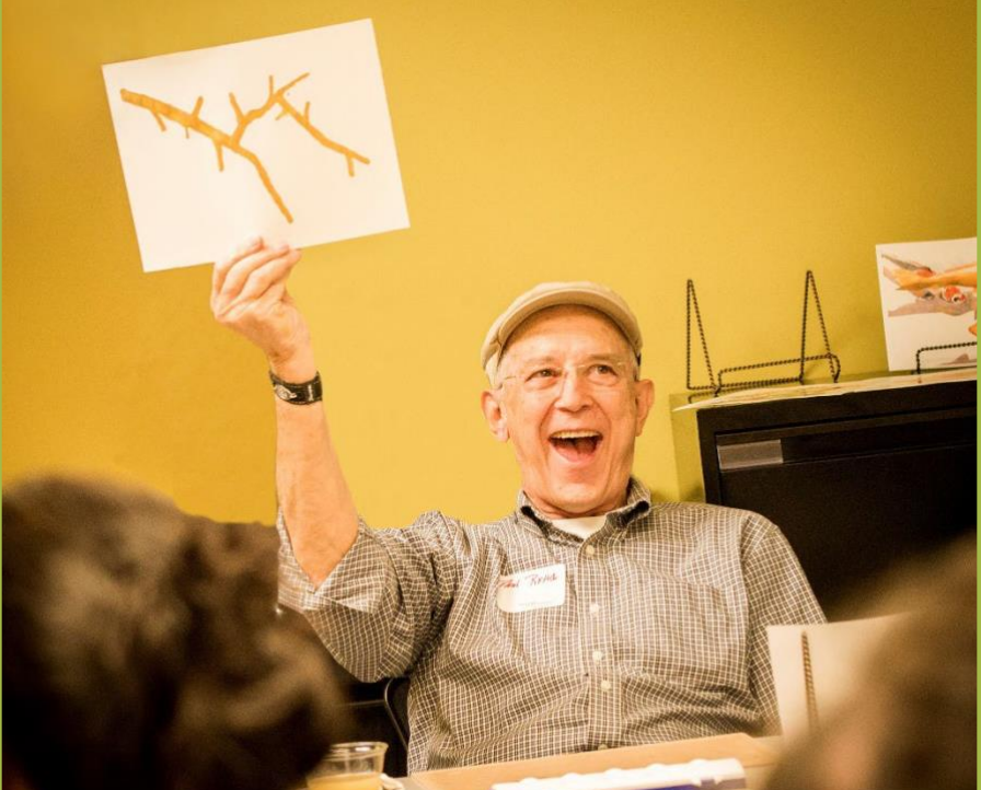
صورة التقطتها مؤسسة سان ديبغو لمرض الزهايمر: تكوين الذكريات.

من الممكن أن تخلق المشاريع الفنية شعورًا بالإنجاز والغاية. إذ من الممكن أن تمنح هذه المشاريع الفنية الشخص المصاب بالخرف ومقدمي الرعاية فرصةً للتعبير عن الذات.