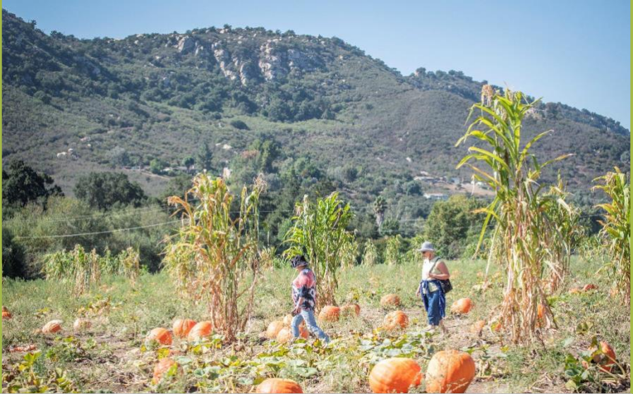
نزهة تعزيز الروابط.

تعد المشاركة الاجتماعية عنصرًا أساسيًا في الحفاظ على نوعية حياة جيدة. ربما لا يزال الأشخاص الذين يعانون من مرحلة مبكرة من مرض الزهايمر أو الأمراض المرتبطة بالخرف، يقضون وقتًا ممتعًا بالخروج إلى أماكن كانوا يستمتعون بها في الماضي كحديقة أو مطعم أو متحف مفضلين، أو يستمتعون فقط بوجود عائلة وأصدقاء يقومون بزيارتهم.